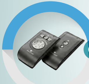
ベルマンドミノプロ+ ¥161,460(税込)

発信機と受信機で構成される集音マイクです。マイクは発信機と受信機それぞれに備わっているので会議に最適です。マイクは無指向性のみです。外部入力是非対応。