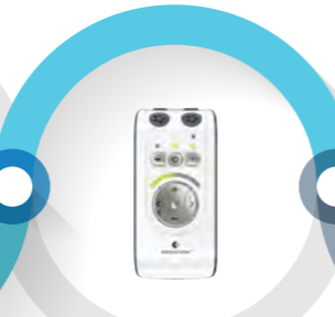
ベルマンミノ+ ¥45,900(税込)

Tコイル内蔵の集音マイクです。ヒアリングループの設備のあるところで使う場合に最適です。マイクは指向性 / 無指向性の切り替えが可能です。外部入力にも対応。