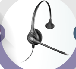
ヘッドセット ¥25,000(税別)

作業をしながらの音声入力や、細かい発言も確実に文字化したい場合はヘッドセットが最適です。常に両手はフリーで、作業をしていてもマイクがずれません。