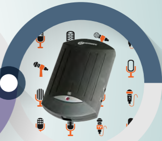
テレホンテキスト ¥23,760(税込)

固定電話の文字化にはテレホンテキストが使えます。電話機に取り付けるだけで簡単に使えます。ビジネスホンにも使えます。