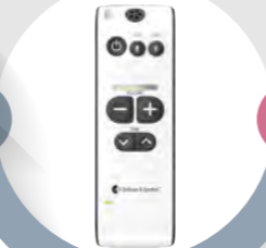
ベルマン マキシプロ+ ¥41,580(税込)

Bluetoothでスマホと接続すれば、無線で音声認識ができます。スマホの通話を音声認識することも可能です。マイクは無指向性のみです。外部入力是非対応です。スマホの通話を文字化するためには、通話している端末以外に音声認識用の端末が必要です。