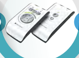
ベルマンドミノ クラシック+ ¥107,460(税込)

講演会や学校の授業などのように、広い場所で1人の人が話をする場面に最適です。離れた場所から発信機で音声を受信機まで送信して音声認識します。また受信機にもマイクが備わっているため会議にも向いています。マイクは指向性 / 無指向性の切り替えが可能です。外部入力対応。