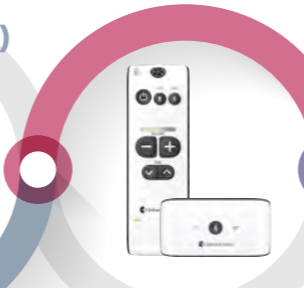
ベルマンマキシプロ+ TVストリーマセット ¥56,700(税込)

ベルマンマキシプロに、高音質なテレビの音声を送信するTVストリーマのセットです。TVストリーマは光デジタル端子を使って音声を送信するため、通常のイヤホン端子から音声を聞くよりも綺麗で明瞭な音声が聞こえ、音質が良いので音声認識率も良いです。